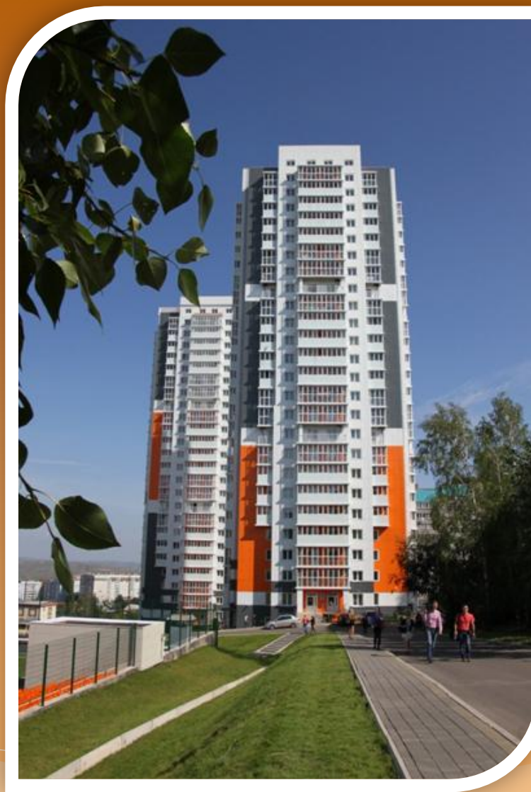
❖ Общежитие №28, пер. Вузовский, 6Д

Заселение в общежития СФУ осуществляется в соответствии с Положением о порядке заселения в общежития.