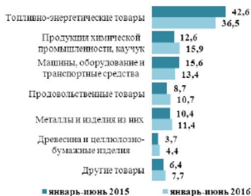
Рисунок 1 – Товарная структура экспорта Российской Федерации

Задание. Используя данные таблиц 1 и 2 определите группы товаров, по которым произошли значительные изменения экспорта за 6 месяцев 2016 года. Используя данные рисунка 1, оцените структуру экспорта РФ в страны СНГ и дальнего зарубежья.