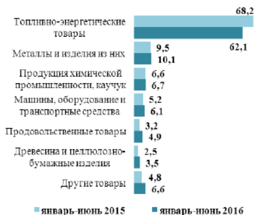
Товарная структура экспорта Российской Федерации в страны дальнего зарубежья (в процентах)