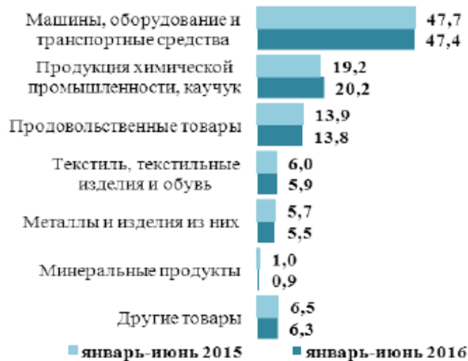
Рисунок 2 – Товарная структура импорта из стран дальнего зарубежья

Задание. Используя данные таблицы 1, определите группы товаров, по которым произошли значительные изменения импорта за 6 месяцев 2016 года. Используя данные рисунков 1-2, оцените структуру импорта в РФ из стран дальнего зарубежья.