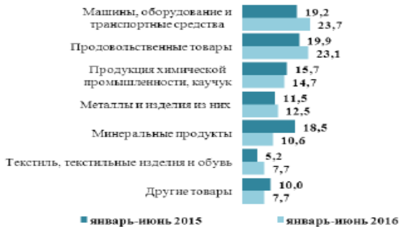
Рисунок 1 – Товарная структура импорта из стран СНГ